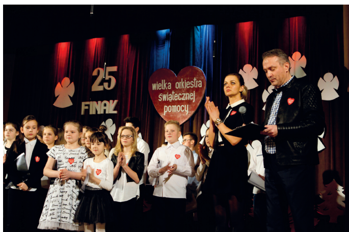
Wójt Gminy poprowadził licytację gadżetów Wielkiej Orkiestry.