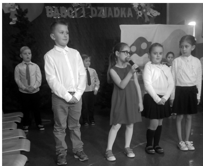
Dzieci z Rusinowic wystąpiły dla Babć i Dziadków.

13 stycznia 2017 r. w Szkole Podstawowej w Rusinowicach odbyła się uroczystość z okazji Dnia Babci i Dziadka. Uczniowie klasy IIa przygotowali inscenizację „O babci, dziadku, wilku i czerwonych czapczkach”, recytowali wiersze i śpiewali piosenki, w których wyrazili swą wielką miłość do babć i dziadków. Zaś szczególnie miłą niespodzianką okazała się sentymentalna podróż, która przeniosła dziadków w lata młodości. Mali artyści z przejęciem odtwarzali swoje role, a czcigodni goście ze wzruszeniem odbierali czułe słowa, kierowane pod ich adresem. Po występach dzieci wręczyły upominki i zaprosiły gości na słodki poczęstunek. Spotkanie upłynęło w miłej i serdecznej atmosferze. Mam nadzieję, że ten dzień na długo pozostanie w pamięci zarówno dzieci jak i dziadków! Gorące słowa podziękowania na-