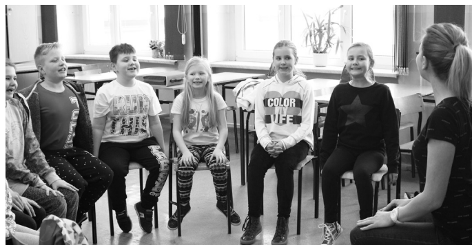
Jedną z atrakcji ferii były warsztaty wokalne.