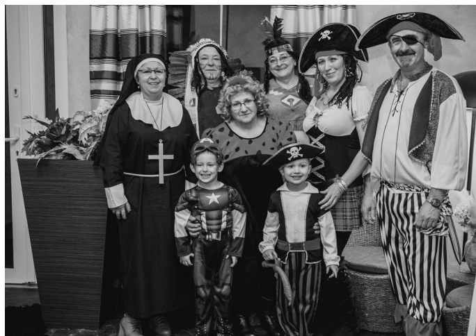
Karnawałowy Bal Przebierańców.