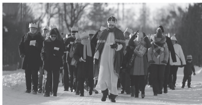
Orszak Trzech Króli to już koszęcińska tradycja.

Wszystkie trzy grupy rozpoczęły swoją wędrówkę o 14.40, tak, żeby mniej więcej około 15.00 spotkać się przy kościele i razem wejść na wspólne kolędowanie. Wspólny śpiew trwał do około 15.45.