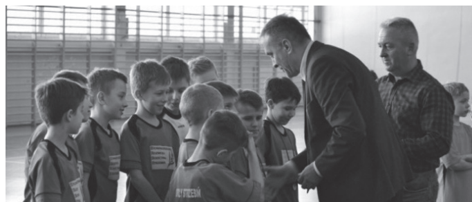
Turniej piłkarski należał do Orłów Strzebiń.

Najwięcej drużyn wystąpiło w kategorii „orliki” z rocznika 2006–2008. W sumie odbyło się sześć bardzo emocjonujących meczy.