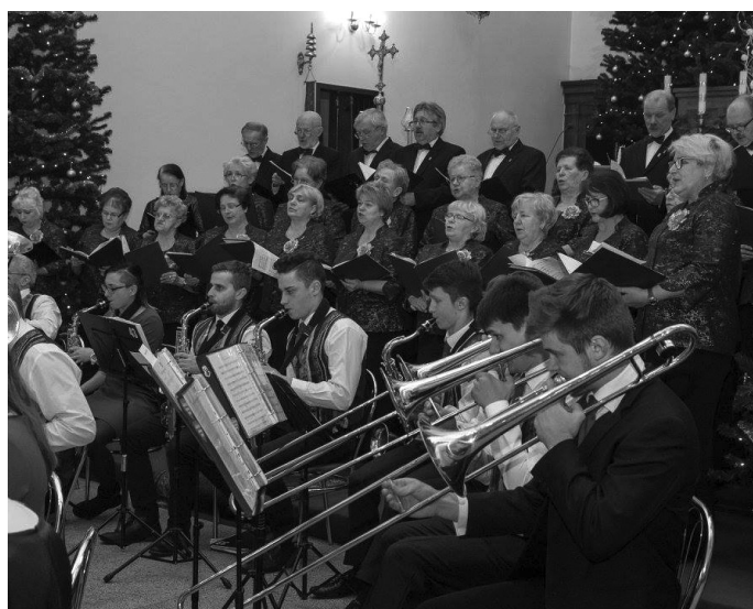
Dla zebranych parafian wystąpił chór Hejnał, Non Nomine i orkiestra dęta.

W okresie Bożego Narodzenia, a szczególnie w wieczór wigilijny, radują serca Polaków, pogłębiają więź rodzinną i narodową. Gdy wielu naszych przodków z powodów politycznych lub biedy