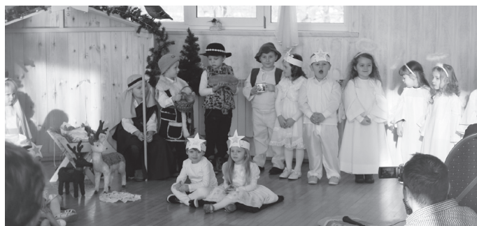
Najmłodszy uczestnik Jasełek miał zaledwie 3 latka.