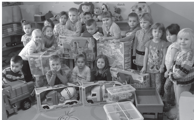
Przedшкоlaki testowały zabawki firmy „Wader-Woźniak”.

[Nauczycielki z Przedszkola w Rusinowicach]