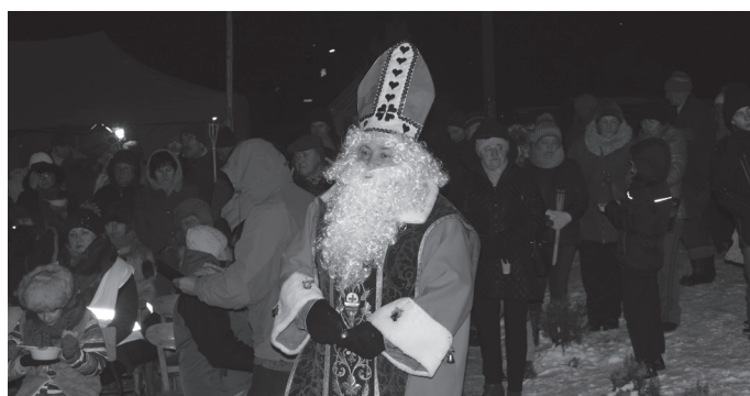
Marsz „Od stajenki do stajenki” przebiegł w 17-stopniowym mrozie.