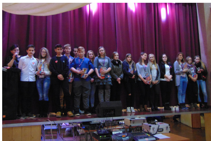
Wolontariusze ze Strzebinia zostali nagrodzeni gromkimi brawami.