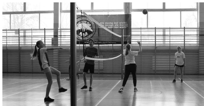
Zajęcia sportowe odbywały się dwa razy w tygodniu w każdej z czterech miejscowości.