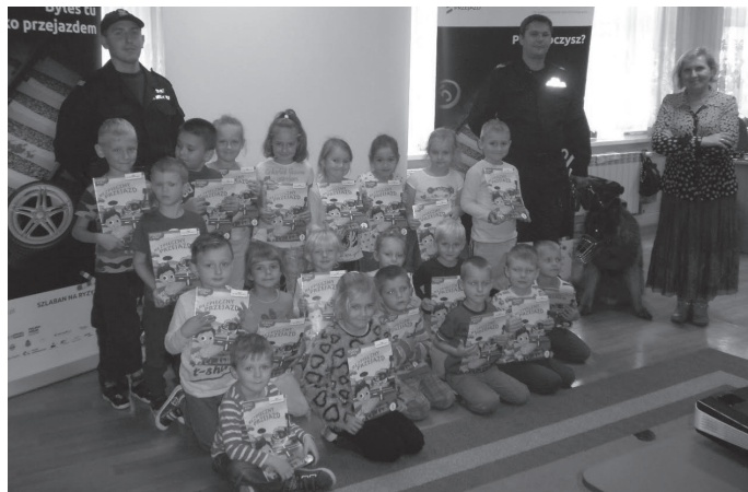
Przedszkolaki ze Strzebinia poznały zagrożenia związane z ruchem kolejowym.

Nasze przedszkolaki obejrzały film edukacyjny, potem rozwiązywały zagadki i odpowiadały na pytania. Przedstawiciel Straży Ochrony Kolei powiedział dzieciom o swojej trudnej pra-