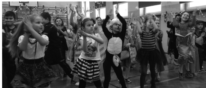
Bal przebierańców w Zespole Szkół w Strzebiniu należał do udanych.