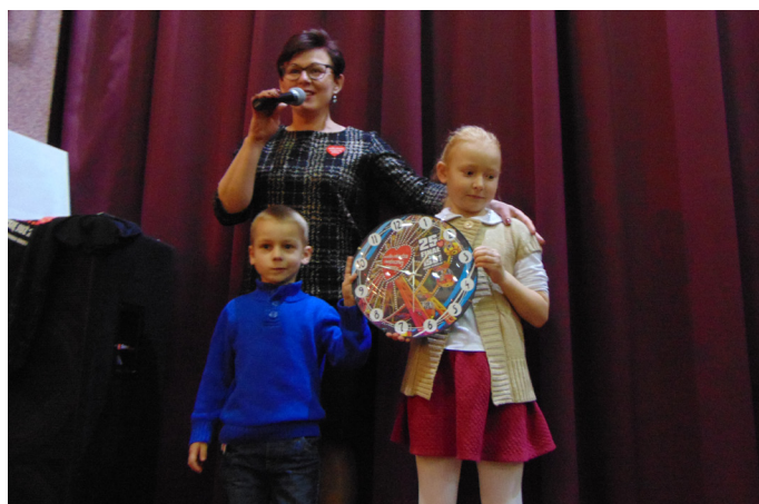
W Strzebinie nie brakowało chętnych do wejścia w posiadanie gadżetów WOŚP.