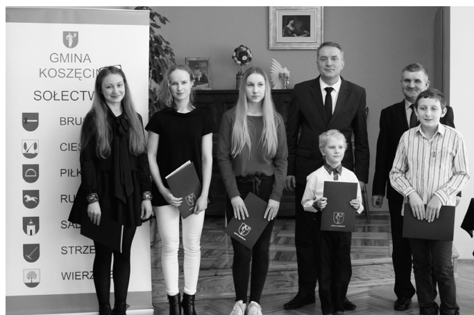
Laureaci nagród Wójta i Rady Gminy.