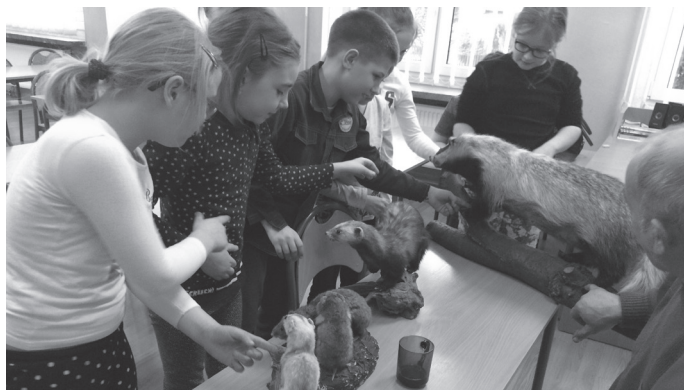
Uczniowie ze Strzebinia odbyli ciekawą lekcję przyrody.