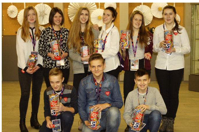
Wolontariusze z Koszęcina uzbierali rekordową sumę.