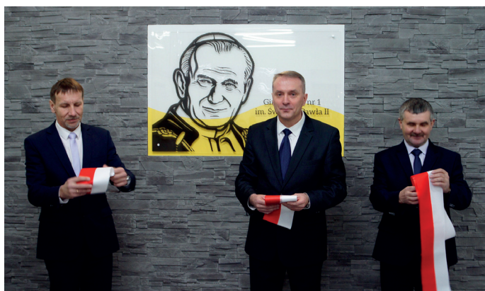
Gimnazjum w Koszęcinie zyskało wspianego patrona.