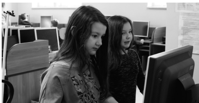
Największą popularnością cieszyła się rozrywka z komputerem.