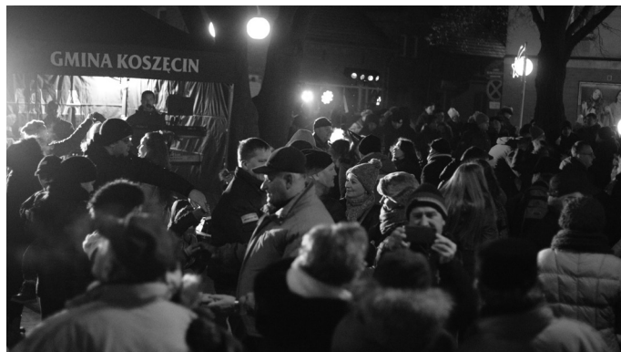
Sylwester na rynku w Koszęcinie to była prawdziwa petarda.