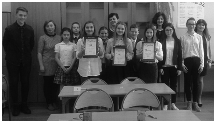
Zwycięzcy Gminnego Konkursu Ortograficznego.