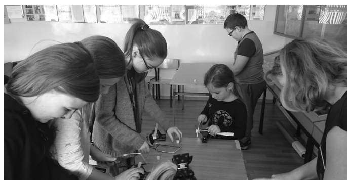
W Sadowie nie brakowało małych odkrywców.