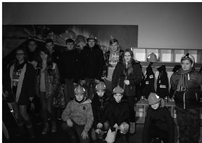
MDP ze Strzebinia w ferie nie próżnowała.