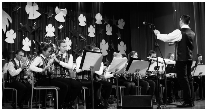
Orkiestra dęta ze Strzebinia dała emocjonujący koncert.