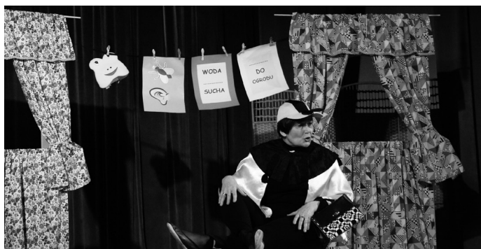
W Strzebinie i w Koszęcinie dla całych rodzin wystąpił AleTeatr.