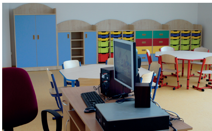
Dobudowane pomieszczenia szkoły wraz z wyposażeniem robią wrażenie.

Z okazji Dnia Kobiet składamy wszystkim Paniom najserdeczniejsze życzenia pomyślności, życiowych radości, zdrowia i samych słonecznych dni.