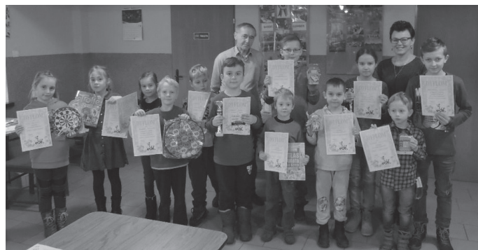
Młodzi szachiści zmierzyli się ze sobą w turnieju o puchar Dyrektora Domu Kultury.

Dzieci dzielnie walczyły o każdy punkt – ostra rywalizacja trwała do ostatniej rundy, szczególnie na pierwszych stołach. O zaciętej walce na szachownicach świadczy to, że z 48 rozegranych partii tylko jedna zakończyła się remisem! Dla uspokojenia nerwów w przerwach między rundami uczestnicy rozwiązywali zadania szachowe.