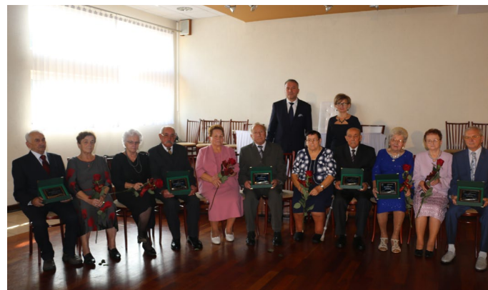
60 lat małżeństwa