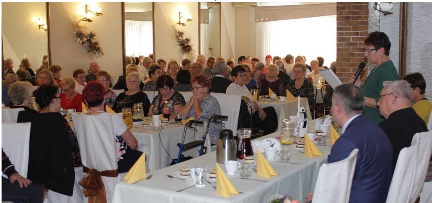
Otwarcie spotkania z okazji Dnia Seniora.