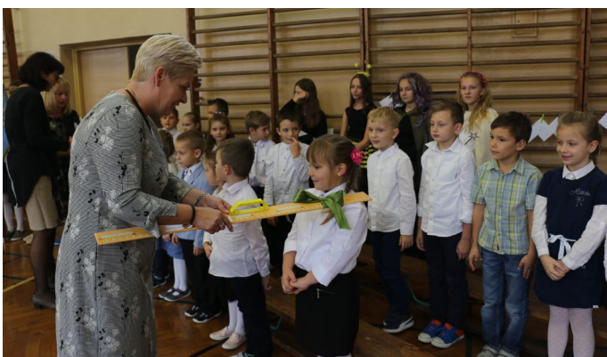
• SP w Strzebinie