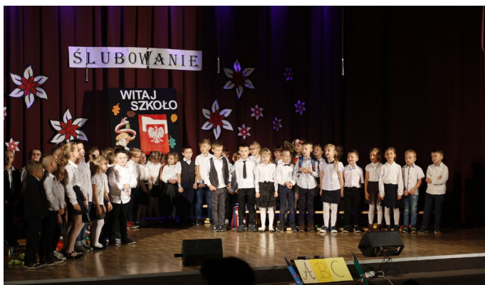
• SP w Koszęcinie