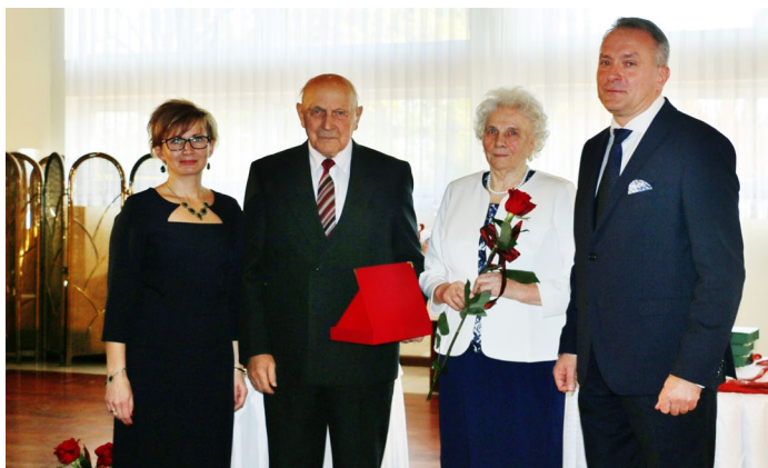
65 lat małżeństwa