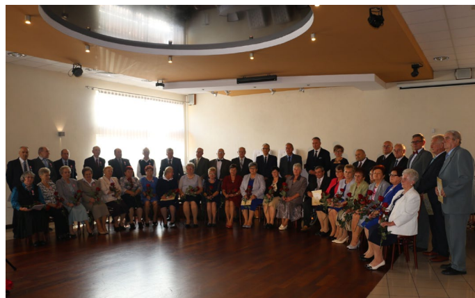
50 lat małżeństwa