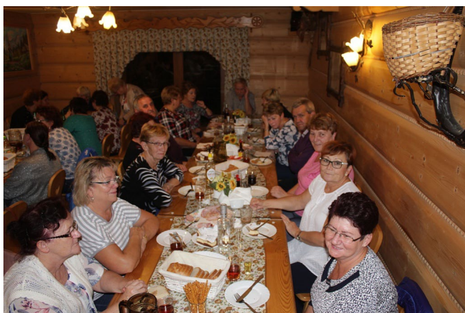
W toku uroczysta kolacji w pensjonacie U Wojtka w Bukowinie Tatrzańskiej.