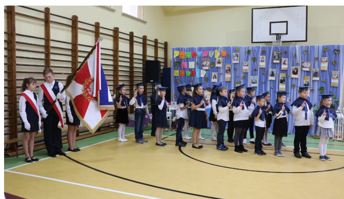
• SP w Sadowie