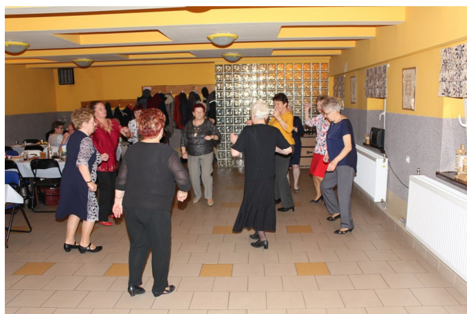
Migawka z zabawy Andrzejkowej.