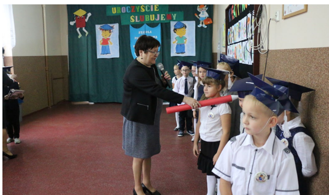
• SP w Rusinowicach