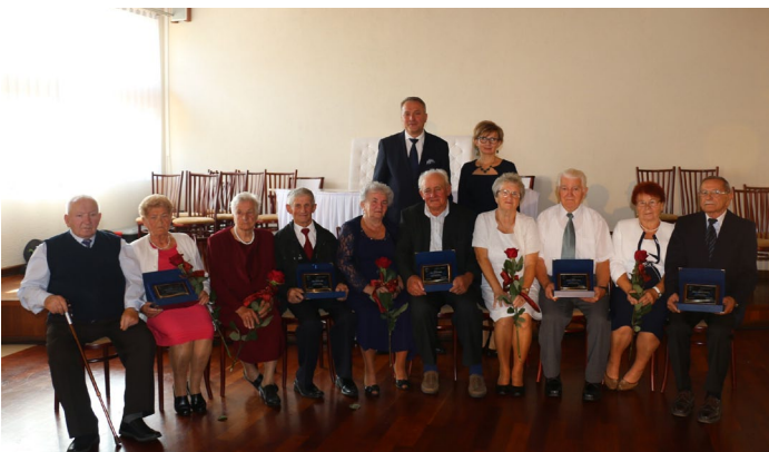
55 lat małżeństwa